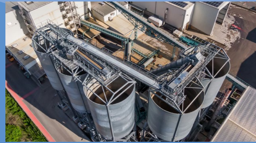
Reinigung belasteter Böden und Bauschutt