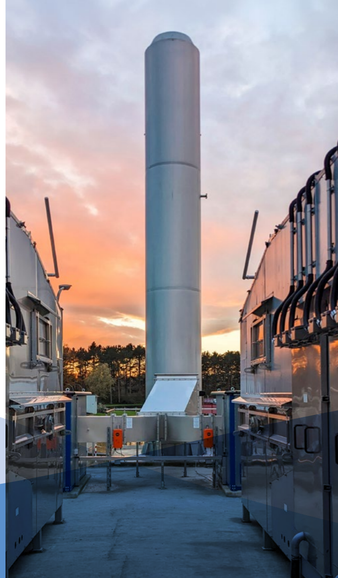
Abluftbehandlung und Geruchseliminierung