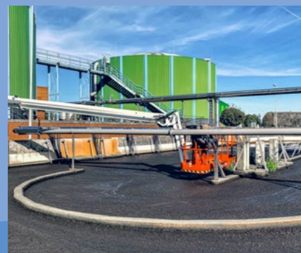
Kommunale Abwasserreinigung und Anaerobtechnik