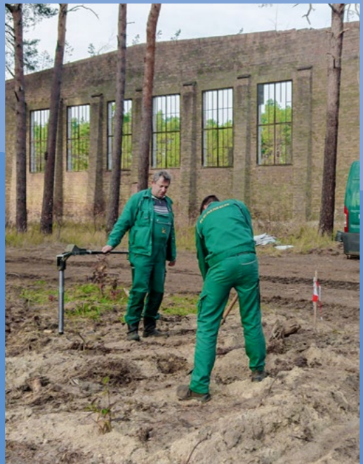
Kampfmittelräumung und -bergung