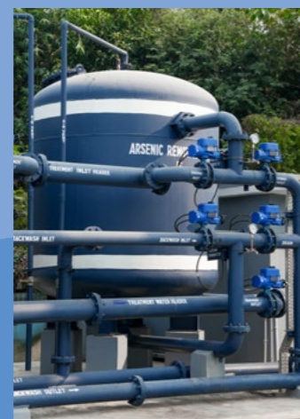
Arsen- und Fluoridentfernung zur Wasseraufbereitung