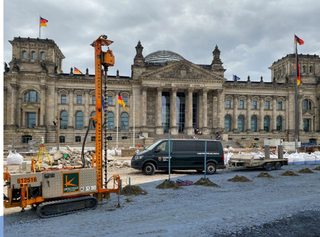
Altlastenerkundung und -sanierung