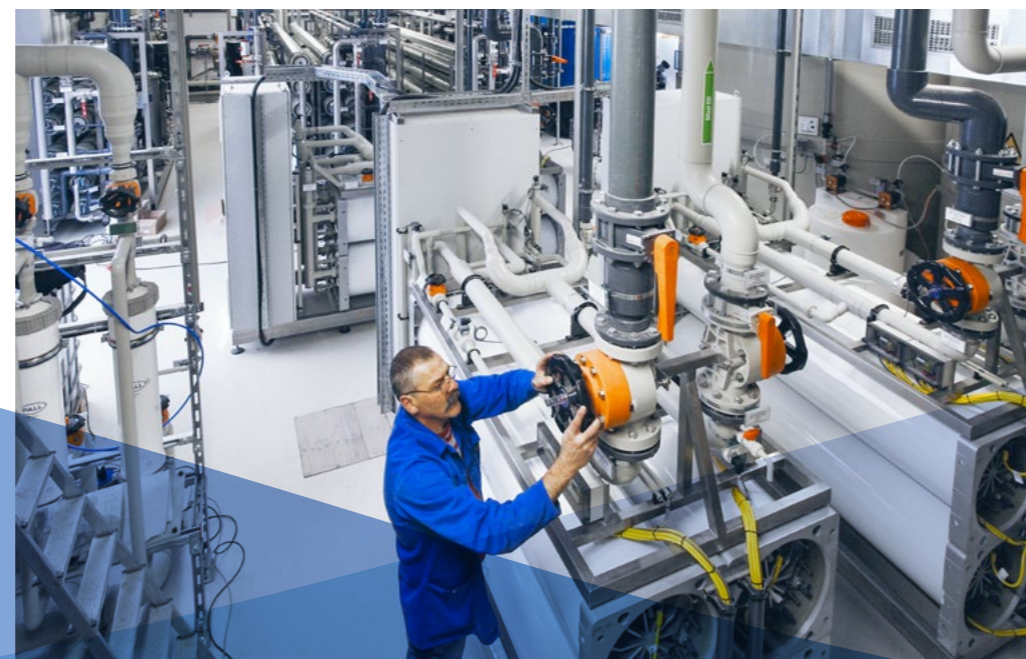
Industriewasserbehandlung, Wasserrecycling und ZLD